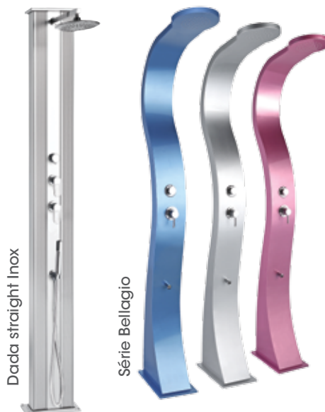
Dada straight Inox