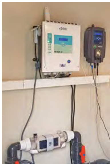
Local technique équipé d'un coffret Meteor-XC

CCEI fabrique des coffrets électriques depuis 46 ans, experte dans l'automatisation et l'entretien des piscines. Sa gamme de coffrets multifonction accessibles se situe entre le coffret standard et la solution de domotique.