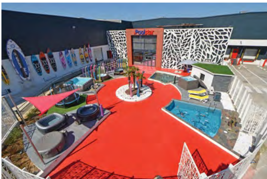
Le nouveau siège de la société sur près de 20 000 m 2 , plus de 1 000 m 2 de bureaux et 2 showrooms dont celui-ci en extérieur, incluant deux piscines chauffées.