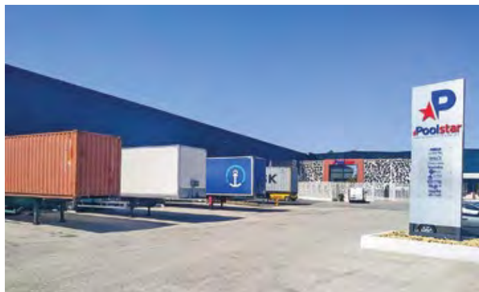
Sur un entrepôt de près de 20 000 m 2 , on aperçoit une partie des 23 quais de chargement.