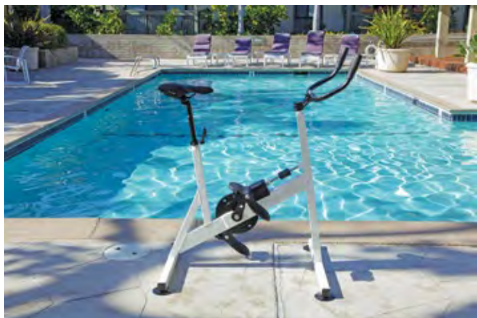
Idéals pour les cours collectifs, 5 modèles d'aquabike en aluminium sont venus étoffer la gamme de Walter. De fabrication française, ils se distinguent par leur légèreté, leur résistance mécanique et à la corrosion.