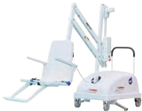
Le lève personne PAL chez SCP est 100 % mobile, sur roulettes, et ne nécessite aucun ancrage. Grâce à sa motorisation et à sa télécommande (étanche), la descente et la remontée s'effectuent sans effort et sans aide extérieure..