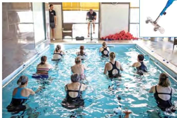
Avec l'aquabike WR3 Air en aluminium de Poolstar Waterflex, la mise en place en bassin est à la fois plus rapide et plus facile. Résultat : un important gain de temps, une rentabilité accrue et une manipulation beaucoup moins pénible qu'avec un vélo traditionnel en inox.