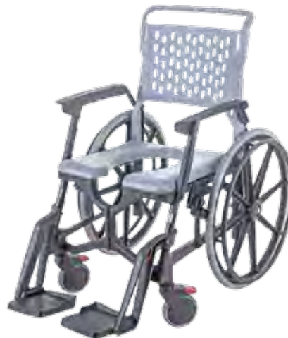
Le Bathmobile d'Axsol permet à son utilisateur de prendre en toute autonomie une douche, confortablement installé, ou d'accéder aux toilettes en toute sécurité. Sa composition 100 % plastique le protège de la corrosion due au chlore ou au sel marin.

D'autres types d'équipements PMR voient également le jour, comme ce sauna accessible à tous de Holl's chez Poolstar. Une initiative à saluer qui intègre une double porte coulissante permettant d'ouvrir et de fermer facilement la cabine. De plain-pied, pour permettre aux fauteuils roulants de passer sans encombre, le sauna est également équipé d'un banc à renforts fixes et amovibles pour une assise autonome. Techniquement, il offre le choix de la technologie infrarouge Full Spectrum ou d'une séance vapeur.