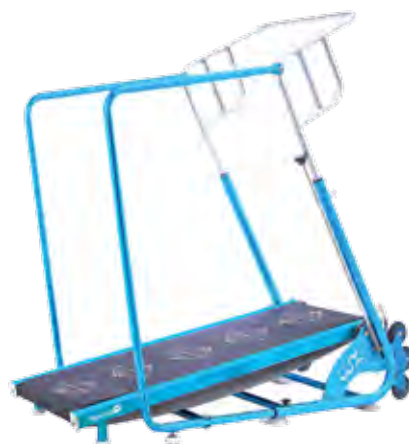
Le tapis de course AquaJogg Air, d'environ 20 kilos, avec barre de maintien amovible pour les débutants (il fait partie de la gamme d'aqua-fitness en Alu Tech de Waterflex Poolstar) s'intègre dans un circuit training.

Cette gamme d'aquabikes se décline en plusieurs modèles avec une version WR3 AIR ultra-légère (moins de 12 kilos) qui possède en plus une pédale nouvelle génération à résistance variable. La version Ino 6 Air, plus sportive, est dotée d'un double système de résistance hydraulique avec une hélice à 6 godets fixes en central et de la fameuse pédale. La version Ino 8 Air, ultra-sportive quant à elle, bénéficie d'un double système de résistance mécanique et hydraulique. Avec elle, on peut modifier l'intensité pour doser l'effort en fonction de la personne et du cours. La pédale nouvelle génération à résistance variable permet d'ajouter de l'intensité si besoin. Cet aquabike offre une performance inégalée et une très grande puissance.