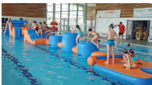
Pensé dans les moindres détails, le parcours gonflé de La Maison de La Piscine a pris en compte le problème de la surveillance avec des modules sans aucun « angle-mort ».

Équipement éphémère par excellence, la structure gonflable a l'avantage de pouvoir se mettre en place et se désinstaller rapidement, tout en nécessitant un minimum de place pour son stockage. La Maison de La Piscine a élaboré un « parcours gonflé » séduisant pour tous. Constituée de différents modules très résistants (qualité de toile optimale avec 1,1 kg/m 2 ), sa conception permet de mixer et de faire évoluer la structure dans le temps. Silencieux et sans danger (pas de soufflerie permanente et par conséquent pas de câble électrique sur le bassin), le parcours gonflable convient aussi bien aux piscines intérieures qu'extérieures (plans d'eau compris).