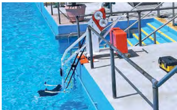
Pas de trous, pas de travaux, pas d'alimentation ! Avec ce modèle Unikart Design d'Hexagone, la mise à l'eau devient un jeu d'enfant pour l'exploitant comme pour les usagers. Il s'adapte à chaque utilisateur grâce à un système de contrepoids ajustable et bénéficie d'un double treuil pour une sécurité renforcée.