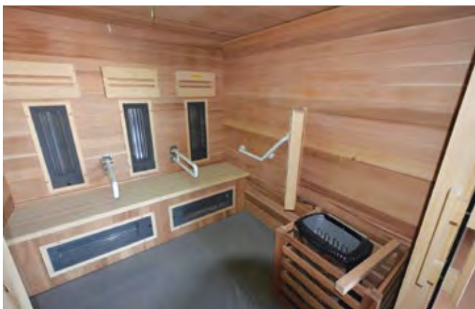
Le sauna Holl's chez Poolstar : une cabine haut de gamme en cèdre rouge et bois d'abachi, conçue pour 4 personnes, avec accès et équipements prévus pour personnes à mobilité réduite.