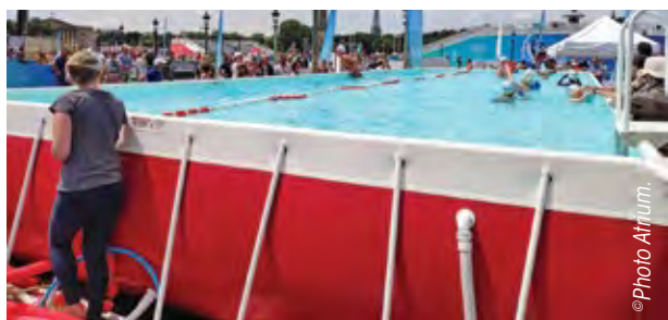
Robuste, qualitative et attractive, cette POP! coloris Coccinella s'est posée élégamment Place de la Concorde pour 2 jours d'apprentissage et de festivités. Elle a été installée par la société ATRIUM, partenaire de Piscine Laghetto® By AstralPool.

Autre exemple de manifestation éphémère avec l'installation d'une piscine hors-sol modèle CUSTOM dans le cadre de l'action « Savoir Nager » à Nice. Cet événement, organisé depuis maintenant 5 années consécutives par la Ligue PACA de la Fédération Française de Natation et de la Ville de Nice, propose aux enfants de s'initier et de pratiquer la natation. Les adultes quant à eux peuvent s'adonner à une activité « sport santé » (aquagym, aquabike...). Cette structure métallique CUSTOM est habillée d'une toile en PVC armé bleu, mesure 7,80 x 15,60 m pour offrir une grande capacité d'accueil. La qualité de l'eau est assurée par des filtres AstralPool, modèle Vesubio, conformes aux normes ARS.