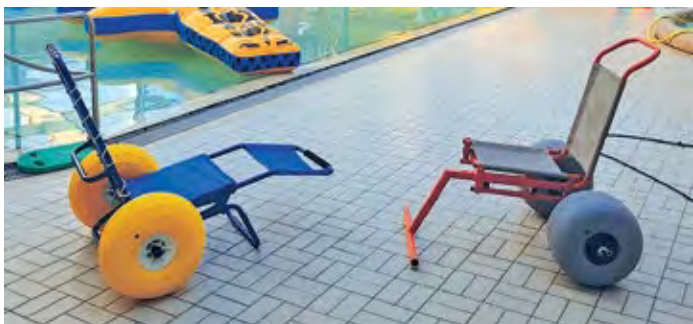
Conçu pour l'accès à l'eau de la personne handicapée en position assise, les fauteuils Unikart 50 et 100 d'Hexagone sont dotés de 2 grosses roues gonflables pour assurer la flottaison durant le transfert. Leur conception avec structure en inox qualité marine à revêtement thermolaqué et tissu polyester imputrescible lavable les rend très résistants et durables.